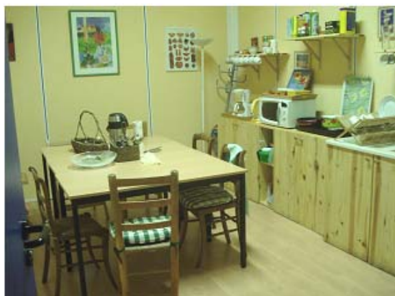
Un espace cuisine pour les pauses