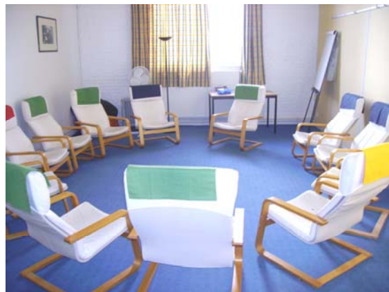
Différentes salles de formation