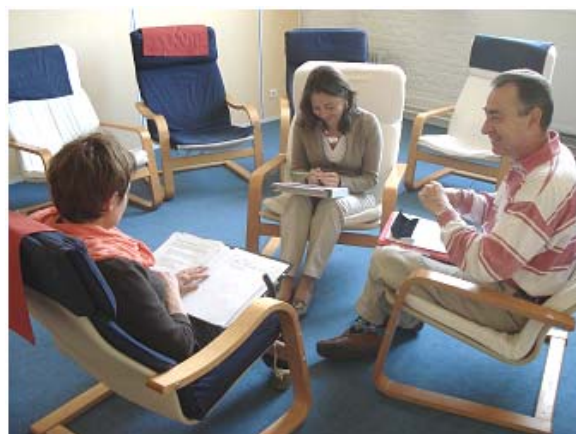
Des salles de formation agréables, spacieuses et confortables