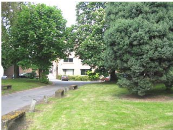
Un site agréable et facile d'accès